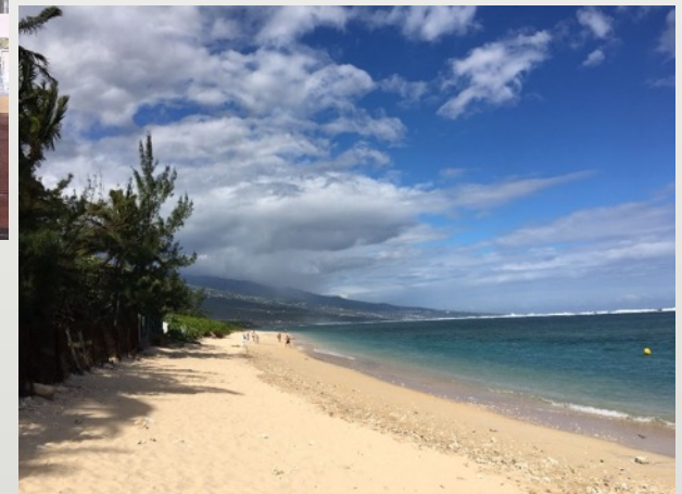
Fabian, Berufliches Gymnasium für Gesundheit und Soziales